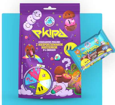
CZEKOLADKI CHOCOCUP I CHALLENGE-OWE PRALINY Z FIRMĄ MILANO