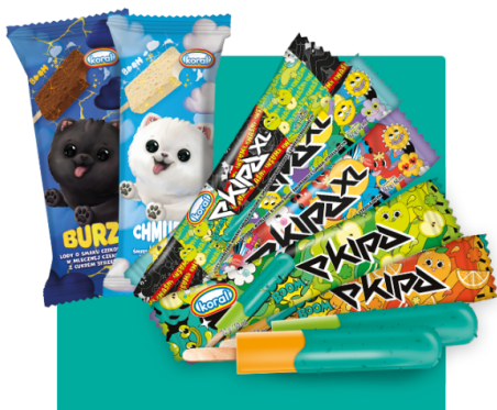
7 SMAKÓW LODÓW Z FIRMĄ KORAL