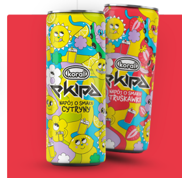
2 SMAKI NAPOJÓW Z FIRMĄ KORAL