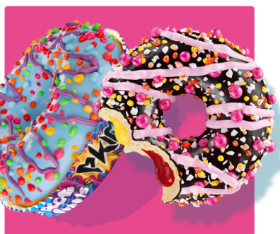
2 SMAKI DONUTÓW Z FIRMĄ DOTTI DONUTS