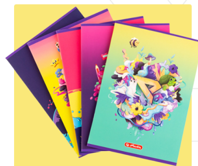
MIX ARTYKUŁÓW SZKOLNYCH Z FIRMĄ HERTLITZ

Ponadto Grupa Kapitałowa realizuje poniższe projekty: