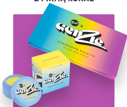
ZESTAW KOSMETYKÓW DO MAKIJAŻU GENZIE Z FIRMĄ BELL