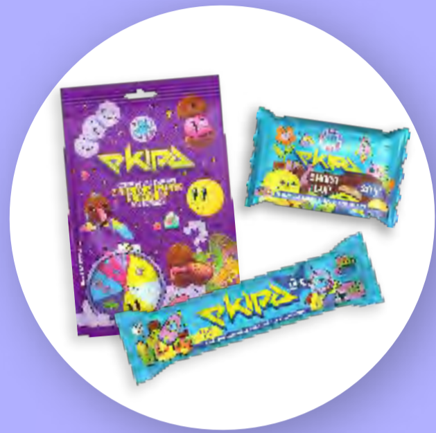
Czekoladowe Choco Cup'y, Batoniki i challenge-owe praliny o sześciu smakach z firmą Millano