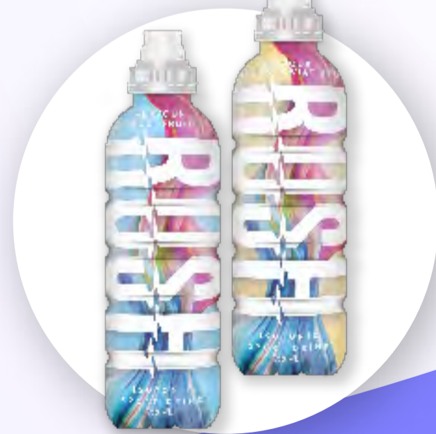
Napój izotoniczny RUSH