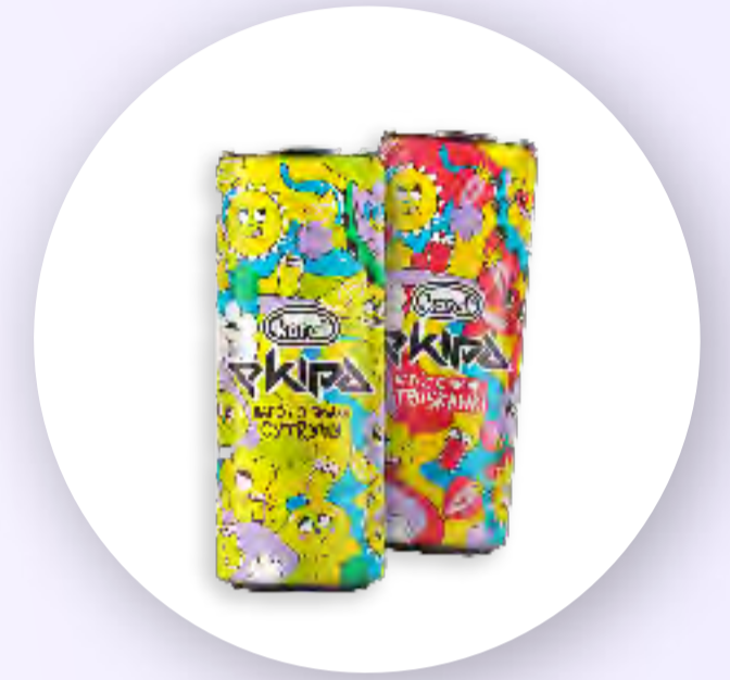
2 smaki napojów z firmą Koral