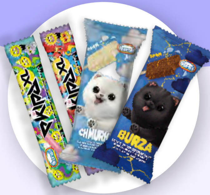
7 smaków lodów z firmą Koral