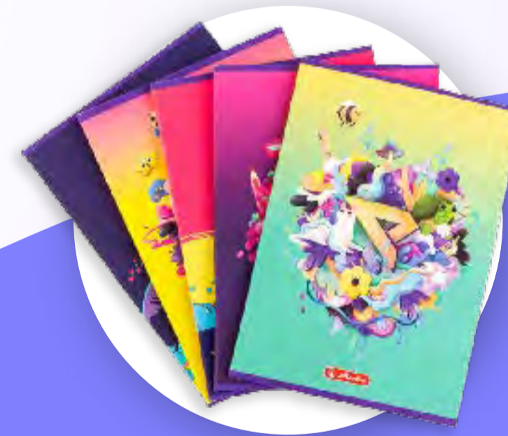
Mix artykułów szkolnych z firmą Herlitz