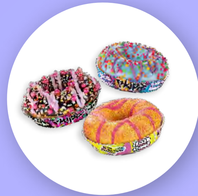
3 smaki donutów z firmą Dotti Donuts (nowy smak we współpracy z projektem Genzie)