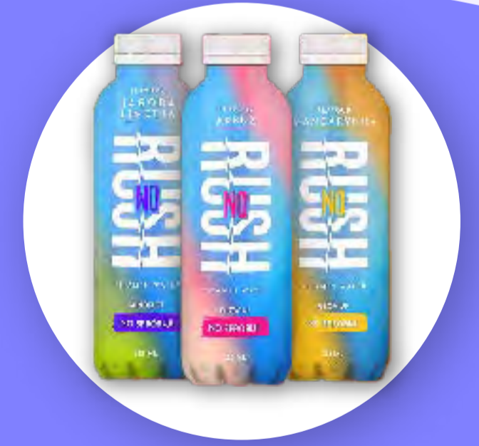
Woda witaminowa noRUSH