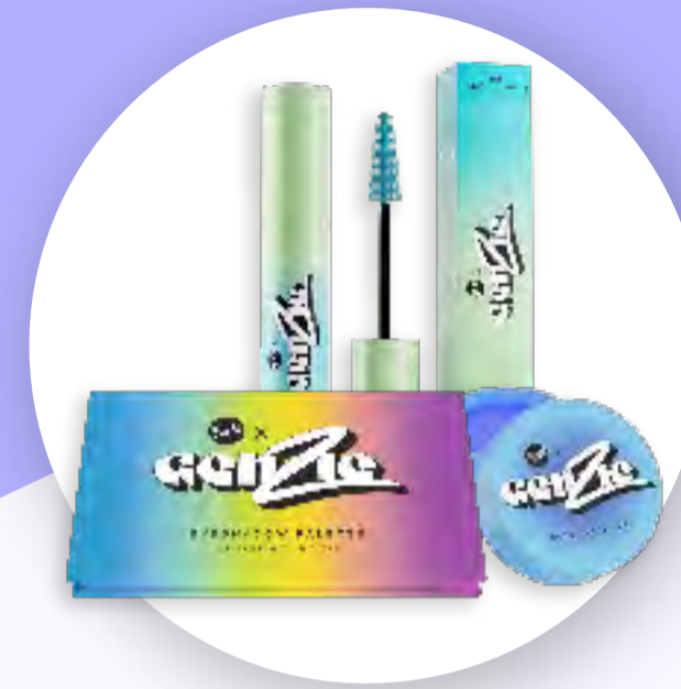
Zestaw kosmetyków do makijażu GenZie z firmą Bell