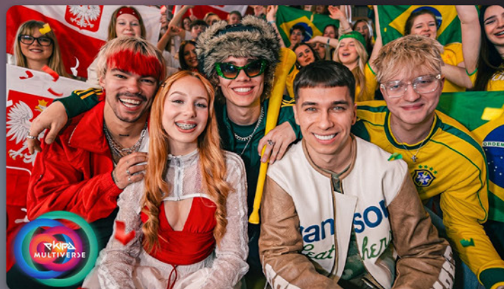
EKIPA - "AKUKU"