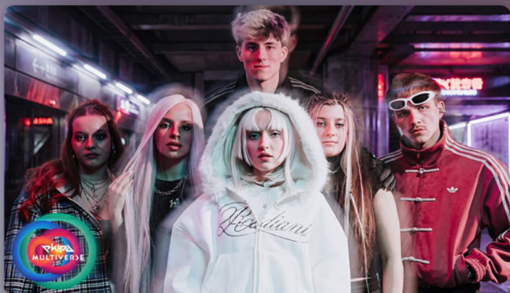
EKIPA - "ARIGATO"