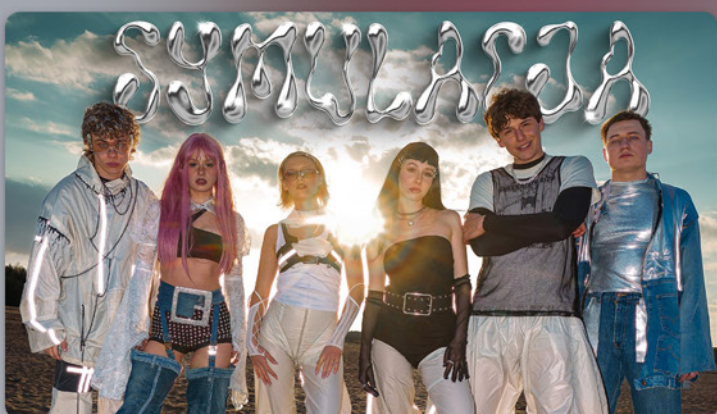
BAZA - "SYMULACJA"