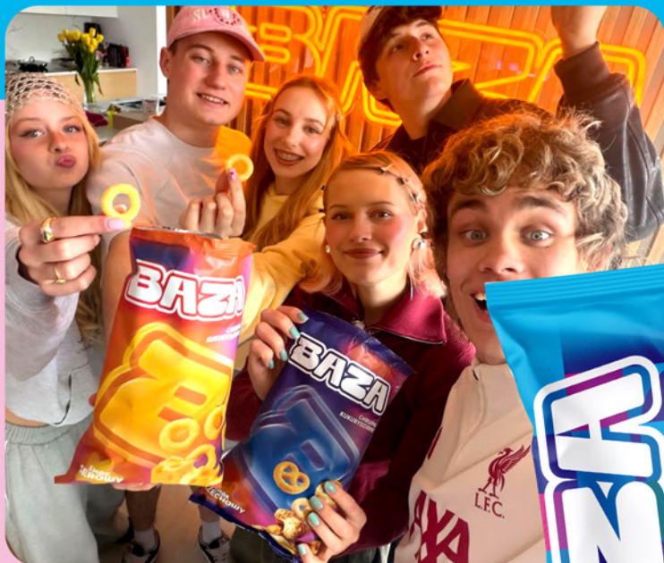
Prażynki od BAZY